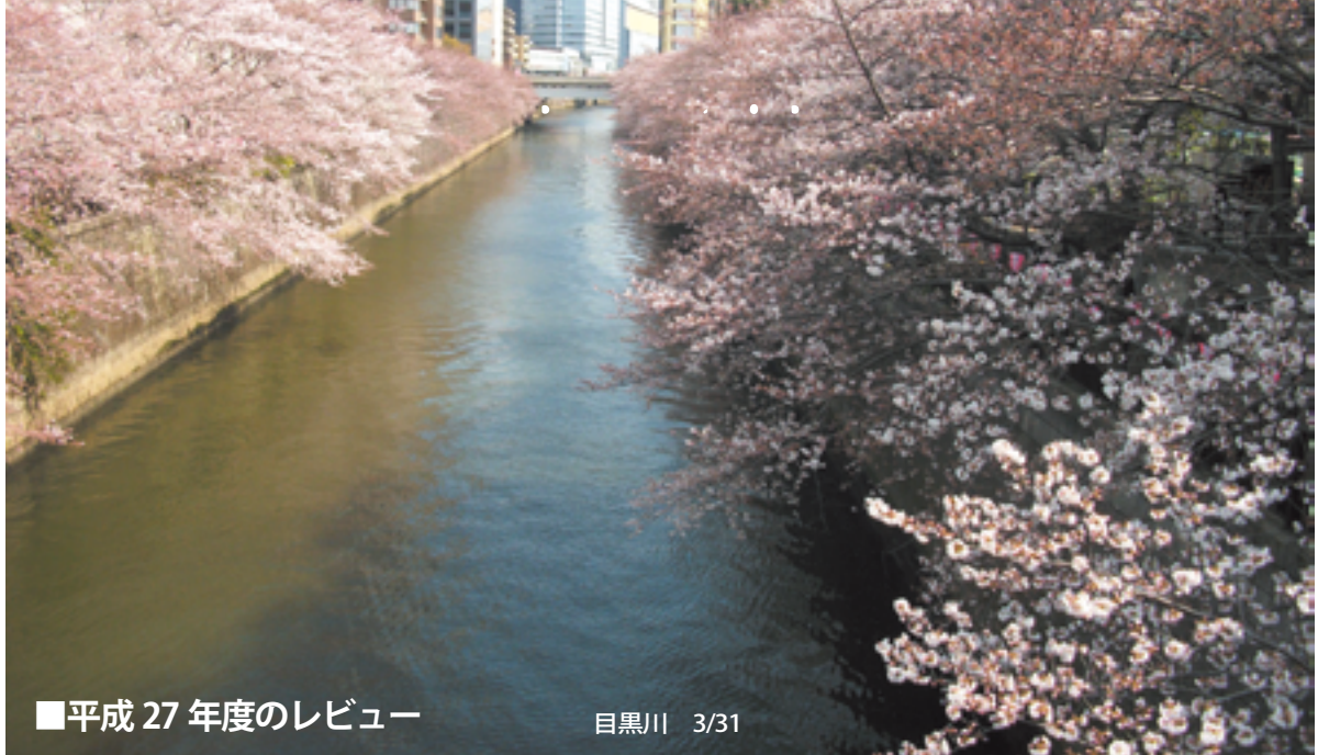
■平成 27 年度のレビュー